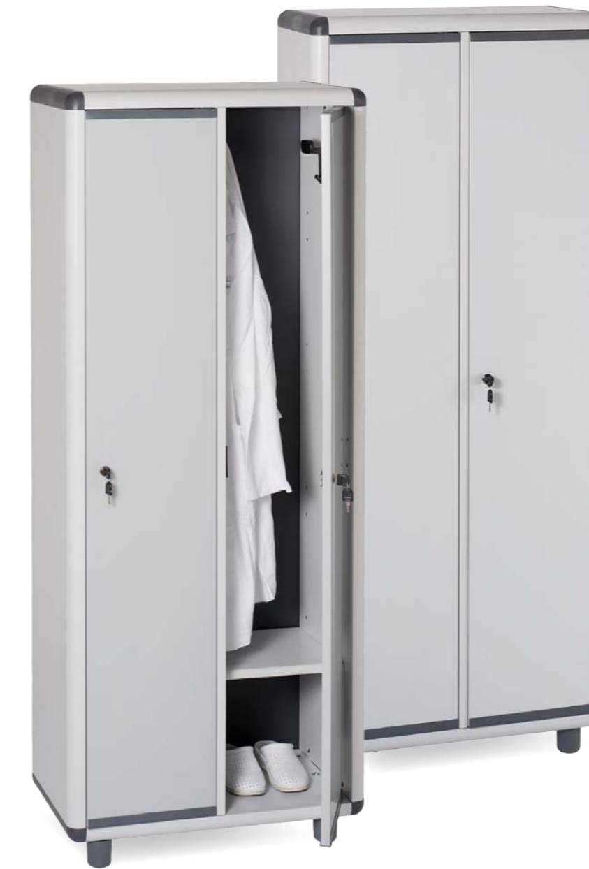
170/2.31/SP - EASY SPOGLIATOI Spogliatoio 2 ante Locker with 2 doors

EAN cod.: 8032605811912 Dim max.: 72x175x39 cm Imballo/Pack: 20pz. per pallet Peso/Weight: 21 kg Dim.: 22x40x164 cm Dim. pallet: 80x164x235 cm