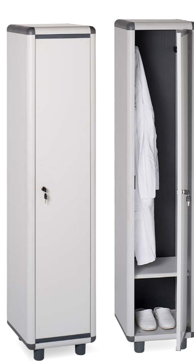
170/1.31/SP - EASY SPOGLIATOI Spogliatoio 1 anta Locker with 1 door

EAN cod.: 8032605811905 Dim max.: 39x175x39 cm Imballo/Pack: 22pz. per pallet Peso/Weight: 10 kg Dim.: 19x40x164 cm Dim. pallet: 80x164x224 cm