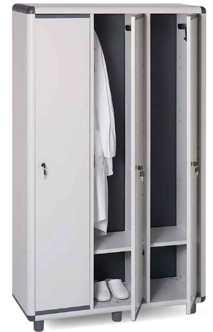
170/3.31/SP - EASY SPOGLIATOI Spogliatoio 3 ante Locker with 3 doors

EAN cod.: 8032605811929 Dim max.: 105x175x39 cm Imballo/Pack: 16pz. per pallet Peso/Weight: 31 kg Dim.: 27x40x164 cm Dim. pallet: 80x164x230 cm